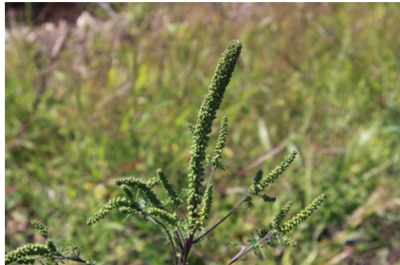
Population d' Ambrosia artemisiifolia L. à la gare de Bischheim, rue du Triage le 20 août 2010