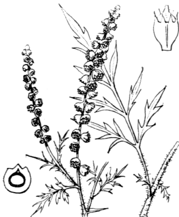
Ambrosia artemisiifolia L. Flore de Coste - Tela-Botanica 2010