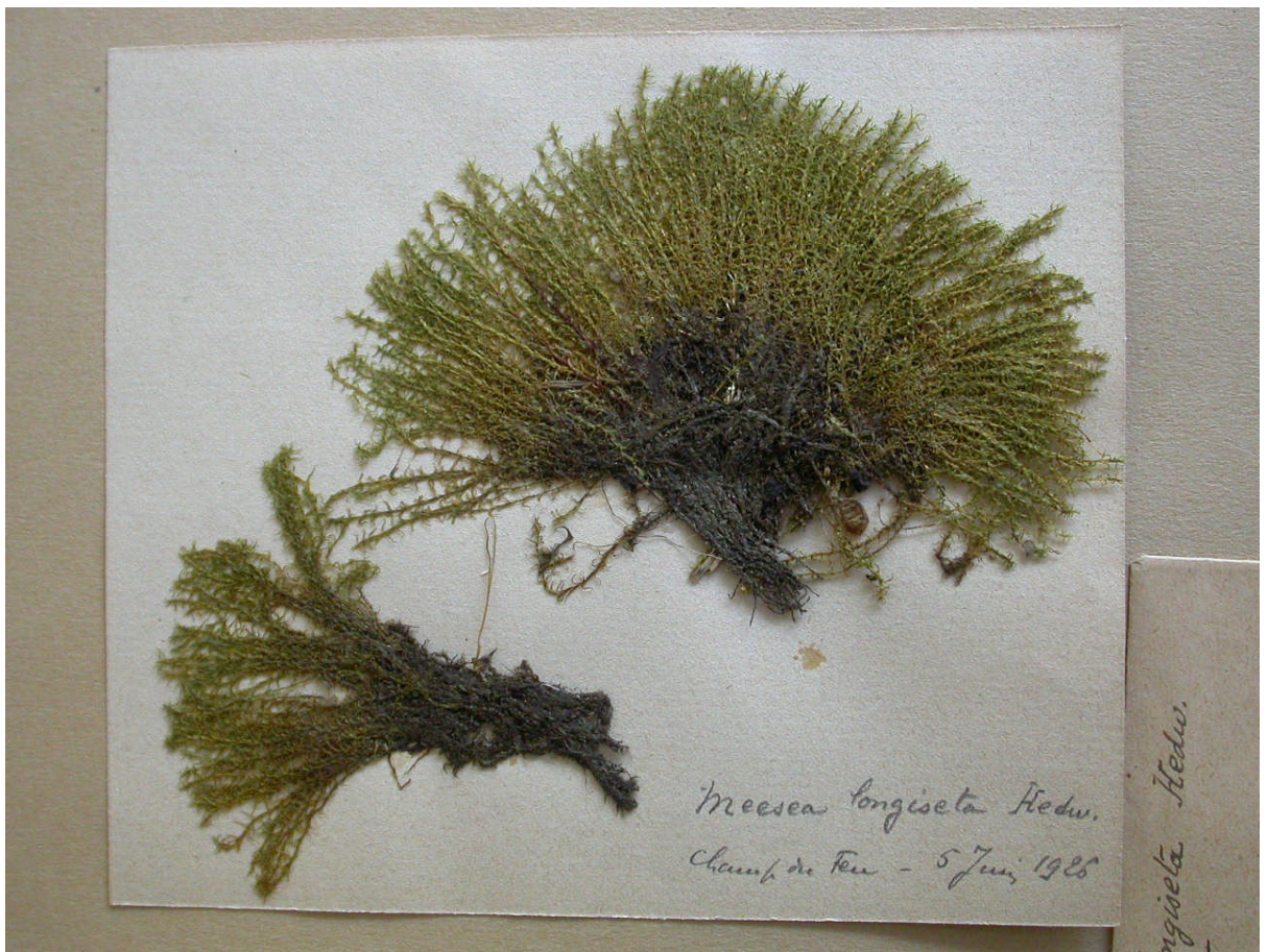
Exsiccata de Meesia longiseta récoltés par Hée au Champ du Feu le 5 juin 1926 (déposé à STR)