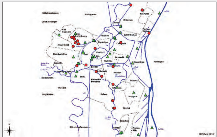
Figure 2 : localisation des nouvelles observations 2010 (triangle vert) et 2011 (rond rouge)