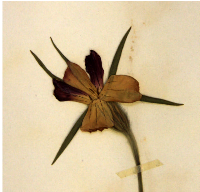
Agrostemma githago L. Herbar Louis Grauvogel STR- 62014