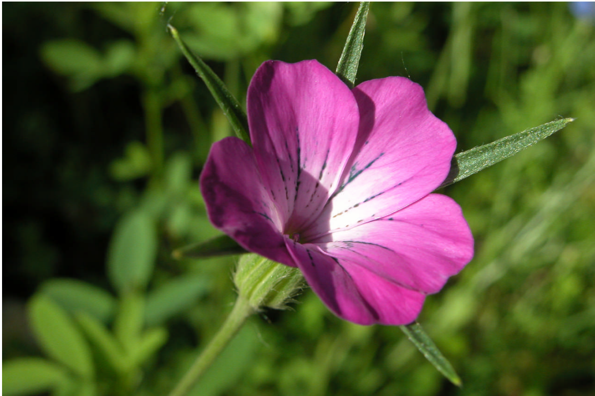
Agrostemma githago L.. Schiltigheim - La Vogelau. 24 Juin 20019

Cette mission flore propose de partir à l'observation de la Nielle des blés ( Agrostemma githago L.) pendant les mois de juillet et août. L'objectif est de : collecter le maximum de données permettant une meilleure connaissance de sa répartition et faciliter sa protection . Cette mission est réalisé par la DREAL (Direction Régional de l'Environnement, de l'Aménagement et du Logement) du Languedoc-Roussillon, dans sa mission de connaissance de la flore patrimoniale afin d'avoir des données récentes sur la répartition de certaines espèces.