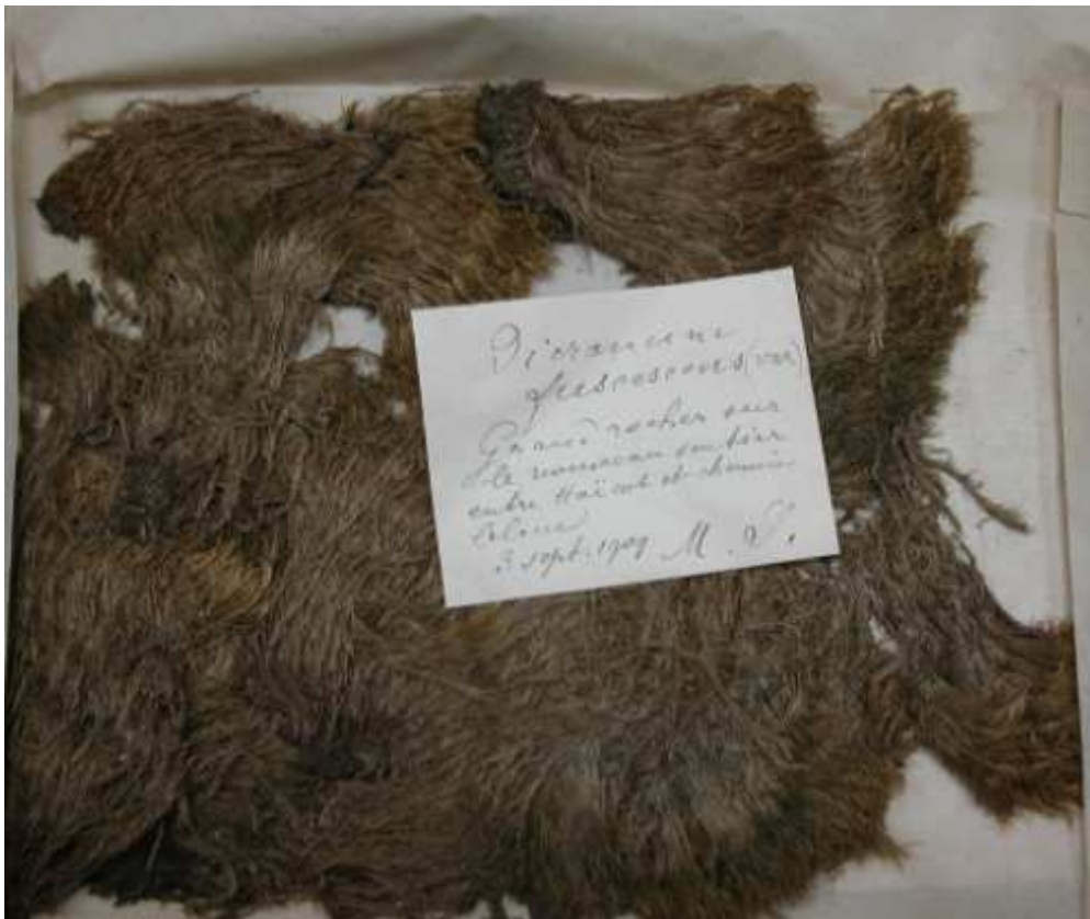
Un échantillon d'herbier

L'Herbier de Strasbourg (STR) héberge un herbier de mousses réalisé par un bryologue qui a laissé sur les étiquettes qu'il a jointes à ses récoltes les initiales de son nom: M. S. Les recherches faites jusqu'ici pour retrouver le nom de ce bryologue n'ont malheureusement pas encore abouti.