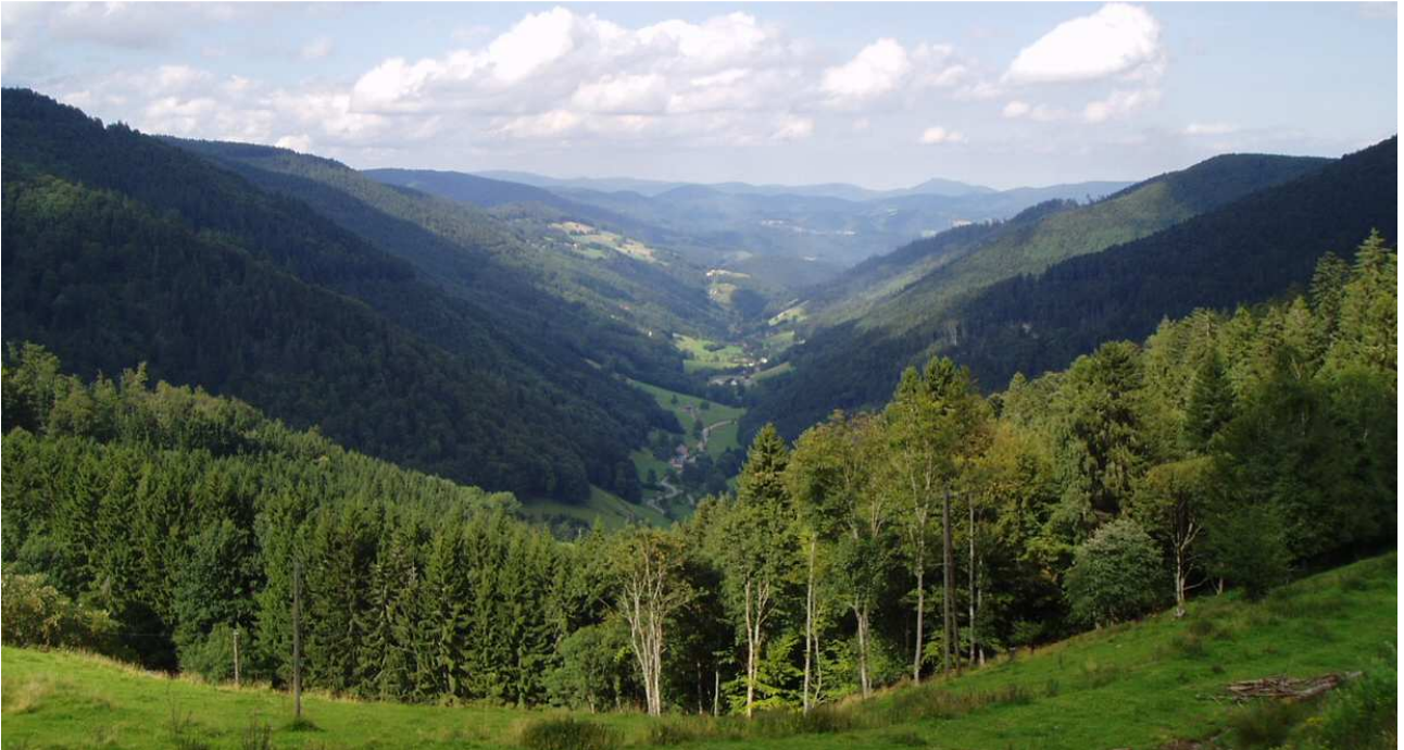
Vallée de la Lièpvrette depuis le Col des Bagenelles