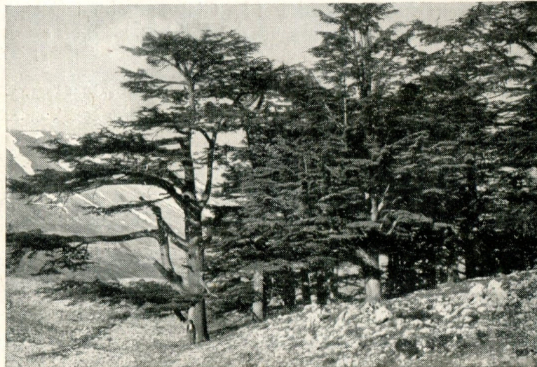
Groupe de Cèdres du Liban.