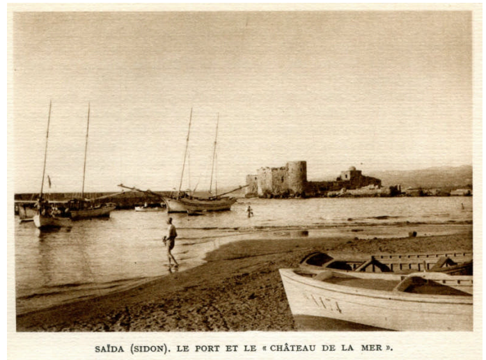
Fig. 5 : Le port de Saïda