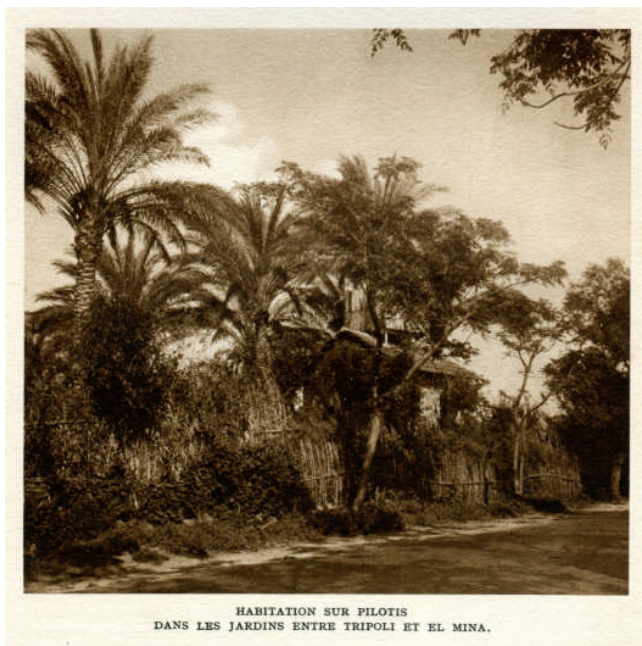
Fig. 4 : Jardins vers Tripoli