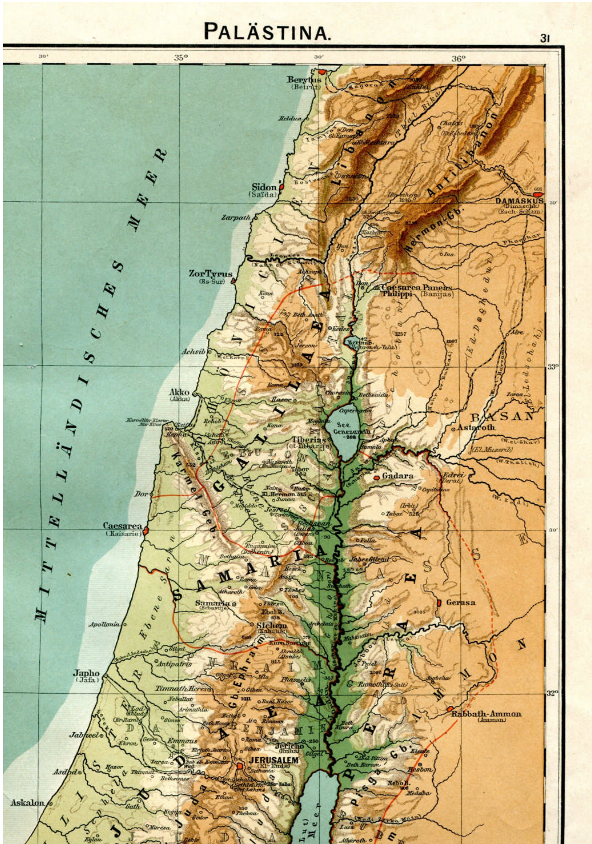
Fig 6 : Le Nord de la Palestine vers 1902